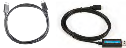
Schnittstellenkabel - VE.Direct Kabel zum Anschluss eines BMV 712 an das Color Control (ASS030530xxx) - VE.Direct zu USB-Schnittstelle (ASS030530000) zum Anschluss mehrerer BMV 70x an das Color Control oder an einen Computer.