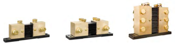
1000 A/50 mV, 2000 A/50 mV und 6000A/50 mV Shunt Die Steckverbinder-Leiterplatte am Standard- 500 A/50 mV-Shunt kann ebenfalls an diesen Shunts montiert werden.