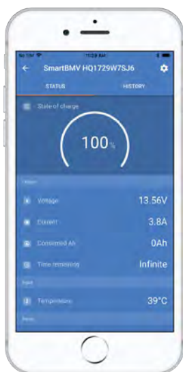
Im VictronConnect BMV App Discovery Sheet finden Sie weitere Screenshots.