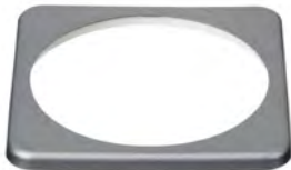
Quadratische Blende für den BMV