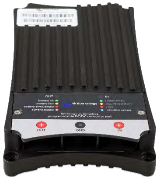
OUT LED Anzeige IN LED Anzeige