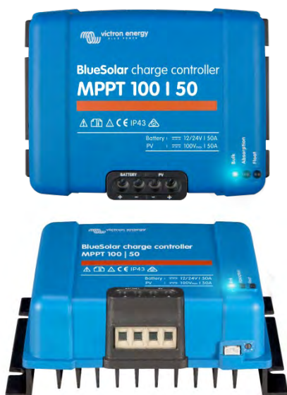
Solar Lade-Regler MPPT 100/50