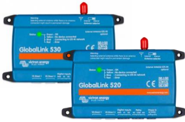
GlobalLink 530 und 520