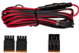
Zubehör im Lieferumfang mit dem GlobalLink 520 und 530