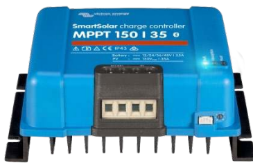
SmartSolar Lade-Regler MPPT 150/35