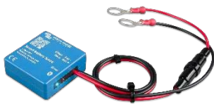
Bluetooth-Erkennung Smart Battery Sense