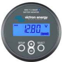
Bluetooth-Erkennung BMV-712 Smart Battery Monitor