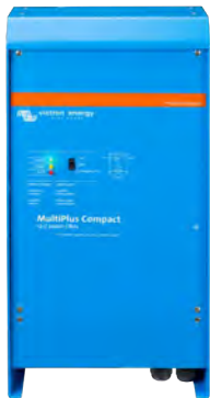
MultiPlus Compact 12/2000/80