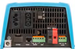
MultiPlus 500 / 800 / 1200 / 1600 VA