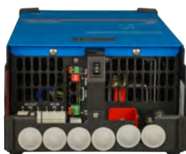
MultiPlus 2000 VA (untere Abdeckung)