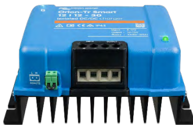
Orion-Tr Smart 12/12-30