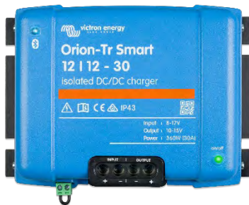
Orion-Tr Smart 12/12-30