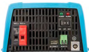
Phoenix 12/375 VE.Direct