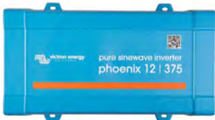
Phoenix 12/375 VE.Direct