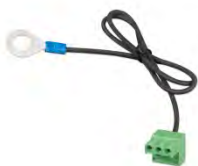
Stecker mit vormontiertem DC-Minus-Kabel (mitgeliefert)