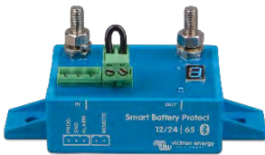
Smart BatteryProtect BP-65