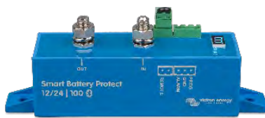
Smart BatteryProtect BP-100