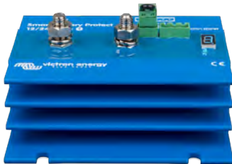
Smart BatteryProtect BP-220