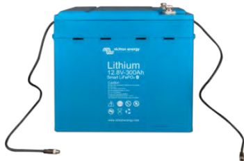
12,8 V 300 Ah LiFePO 4 Batterie

Dies ist sehr nützlich, um ein (mögliches) Problem wie ein Zellenungleichgewicht zu erkennen.