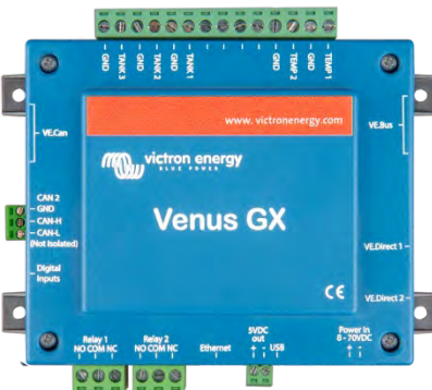
Venus GX mit Steckern