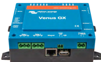
Venus GX Vorderansicht